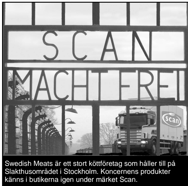
Swedish Meats är ett stort köttföretag som håller till på Slakthusområdet i Stockholm. Koncernens produkter känns i butikerna igen under märket Scan.

... och som ko eller höna har du det ungefär lika illa. Men det måste inte vara så här. Det är du som konsument som är ansvarig för att det fortsätter. Rösta med dina pengar och byt ut köttet mot vegetabilier!